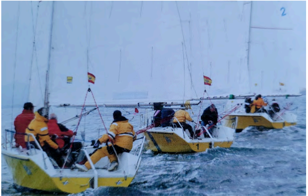
Riggtrimm-, Spinnaker- und Regatta-Training in der Bucht von Pt. Pollensa/ Mallorca

Gotti, der Leiter der Segelschule Sail&Surf, drängte mich: "Da liegt noch ein HOBIE am Strand, willst Du nicht mitmachen?" Und so nahm das Schicksal seinen Lauf. Mein Vorschoter - bereits im hohen Rentenalter - und ich brachten es auf gut 125 Jahre und kannten die Geheimnisse des HOBIE-Regattasegelns nur zaghaft. Und so traten wir gegen ein paar Cracks vom Dümmer-See und eine Mädelscrew an. Und wurden Zweiter in der ersten von vier Wettfahrten, geschlagen nur von den Mädels. Mein Interesse an dem steuernden Blondschof war geweckt. Nun mussten dieser Crew die Grenzen gesetzt werden: Wir gewannen die