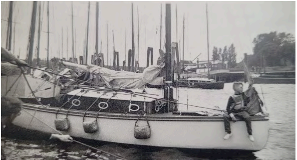
Mit Ariel fing das Regattasegeln an

Es gibt so einige Dinge, die ich noch gut erinnere. Nicht nur den Topfkuchen vor dem Clubheim am Sonntag-Nachmittag. Ich wurde im Dezember 1958 als Jugendlicher aufgenommen, für 10 Mark. Der monatliche Beitrag: 50 Pfennige. Hier einige, ganz persönliche Erinnerungen und Eindrücke.