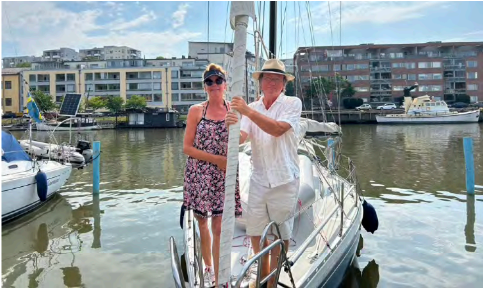
Polly mit Crew in Turku