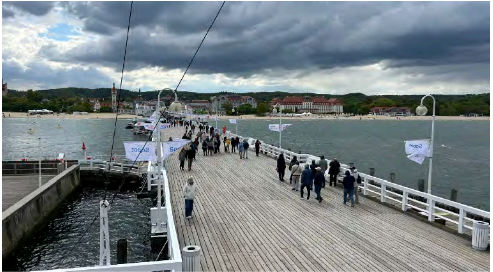
Die imposante Seebrücke von Sopot

allerdings in Ustka eine Horrornacht im Schwell, in der Polly wie ein Wildpferd an den Leinen riss.